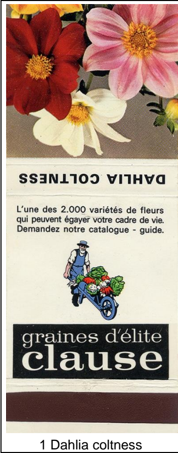
1 Dahlia coltness