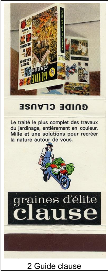
2 Guide clause